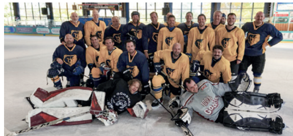
Beim verlassen der Garderobe dem Eismeister auf seiner Morgenrunde begegnet, die Senioren.

Wie jedes Jahr trafen sich die Senioren Mitte Oktober in Herrschried im Trainingslager. Vier komplette Linien und zwei Torhüter hauchten der Garderobe bis in die späten Stunden ordentlich Leben ein. Motiviert startete die verschworene Truppe ins erste Eistraining der Saison und manch einer fragte sich bald einmal, ob das angeschlagene Tempo wohl die ganze Saison durchgehalten werden kann. Nach dem gemeinsamen Nachtessen in der Garderobe, einer ausgelassenen Geburtstagsfeier in der Schwarzwaldspitze, realisierte die Mannschaft in auskurierender Runde einen Besuch der Ausstellung der Weltkugel von Gaia im Dom von St. Blasien. Die Abwechslung der Stunden im Schwarzwald steht sinnbildlich für die Breite dieser tollen Mannschaft. Die Trainings waren während der ganzen Saison sehr gut besucht und alle erfreuten sich über die tollen Trainings. Wie bereits