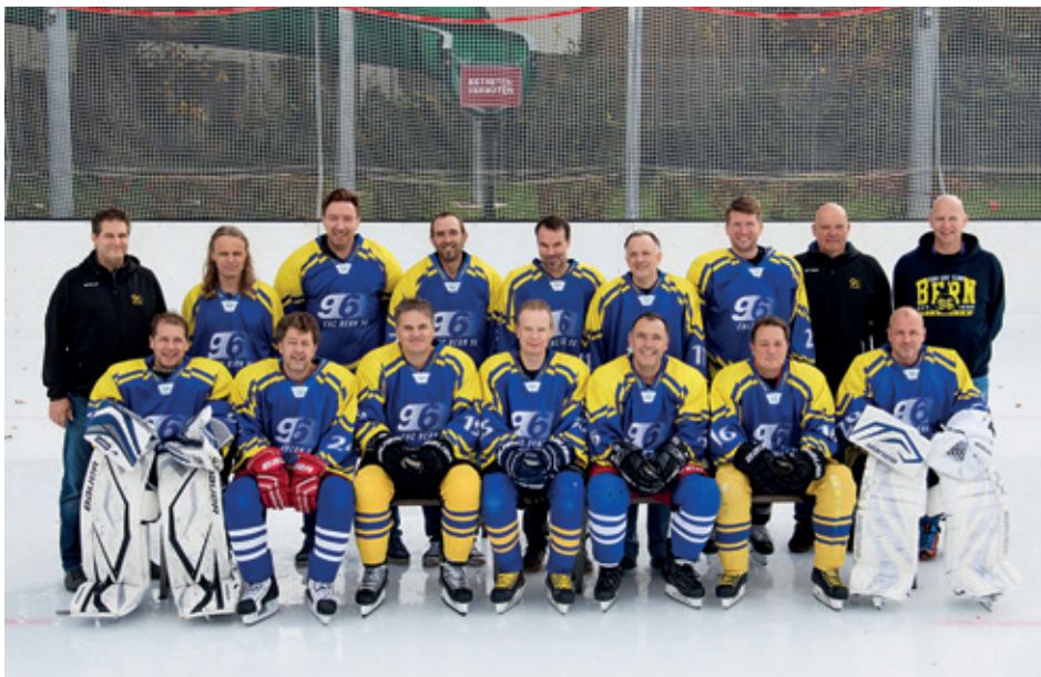
Die Mannschaft der Veteranen blieb diese Saison erneut unverändert.