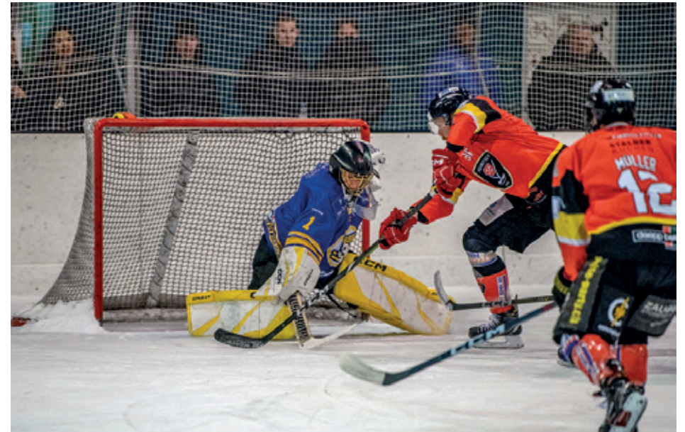
Der spielerische Bereich in den Goalie-Trainings kam nicht zu kurz.