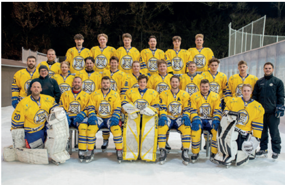
Die Neuzugänge haben sich hervorragend in die 1. Mannschaft integriert.