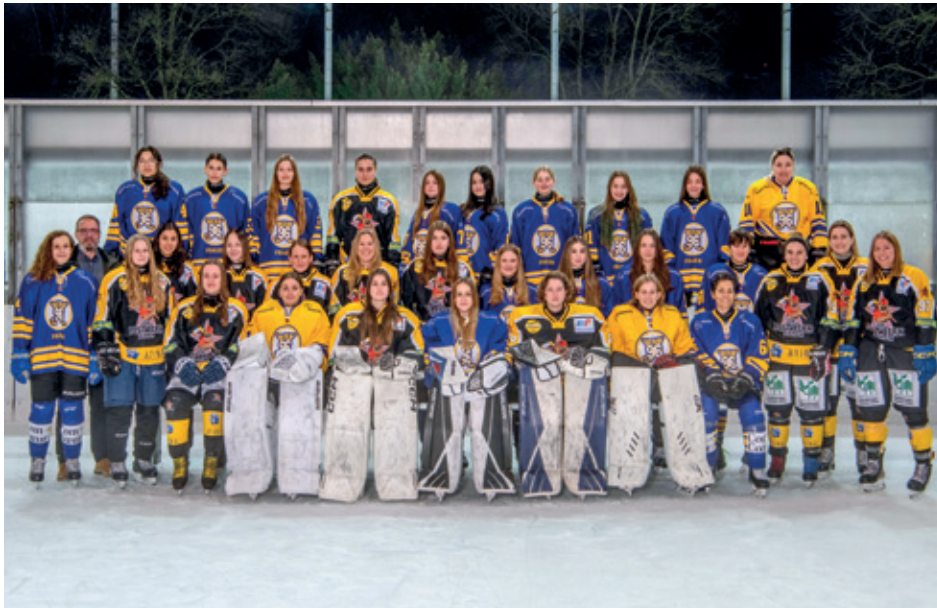
Beindruckende Entwicklung in kurzer Zeit, die EHC Bern96 Frauen.