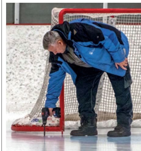
Stellvertretend für alle Helfenden auf und neben dem Eis.