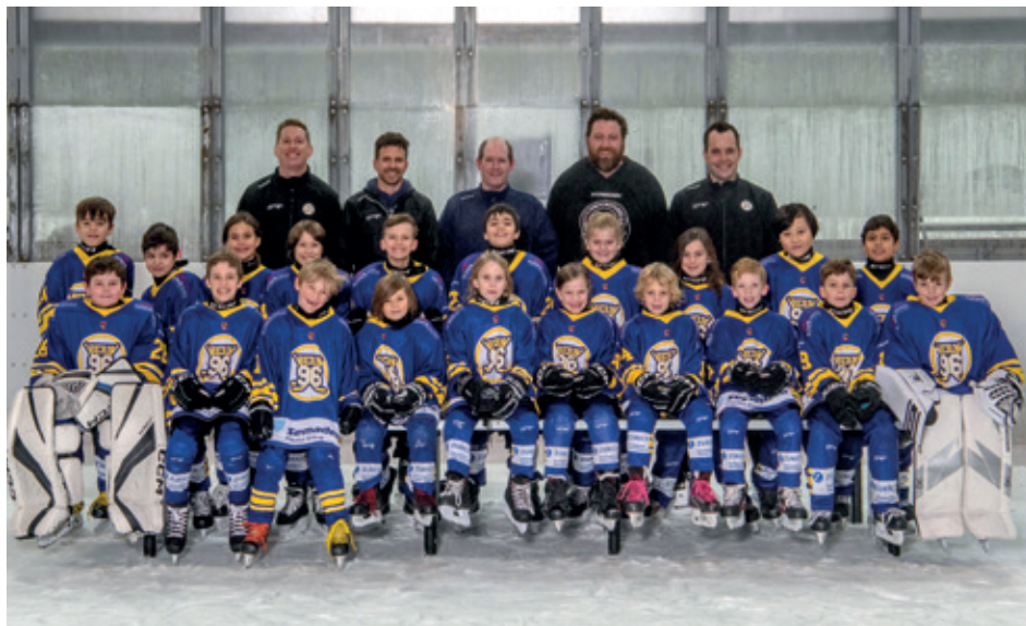
Massen sich mit Teams aus der Westschweiz, Frankreich und Deutschland, die U9.

Nach einer intensiven Off-Ice-Sommervorbereitung sind wir am 10. August in Düdingen erstmals in die Saison 2025/26 auf dem Eis gestartet. Am 6. Oktober kehrten wir im Weyerli anlässlich unserer traditionellen «Intensiv-Woche» wieder aufs Eis zurück.